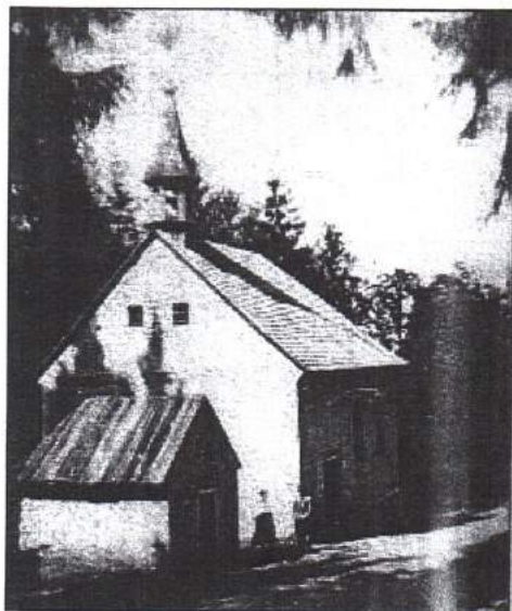
Původní Hauswaldská kaple

sto, kde stály kaple, se ocitlo ve střezném pohraničním pásmu a v roce 1957 armáda „z bezpečnostních důvodů“ kaple srovnala se zemí. A i tehdy se vůle Matky Boží projevila, když místní lidé našli v troskách její neporušenou sošku, kterou umístili do kostela v Srní.